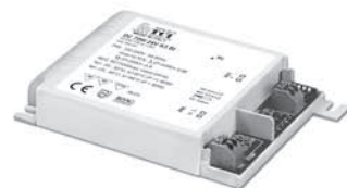
DC 70W K3 BI