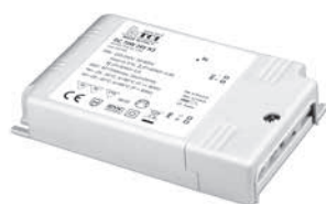
DC 70W K3