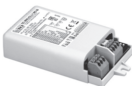
MINIJOLLY MD BI