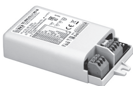
MINIJOLLY MD BI