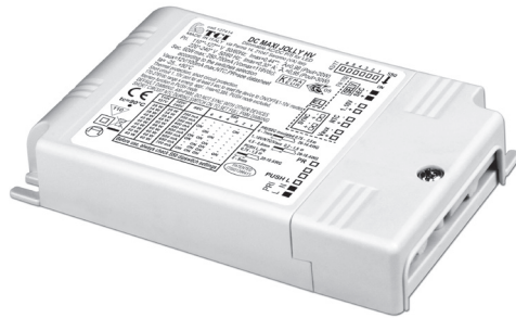
DC MAXI JOLLY HV