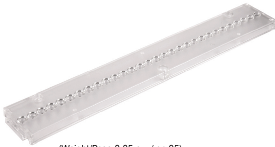
(Weight/Peso 3,35 oz. / gr. 95)