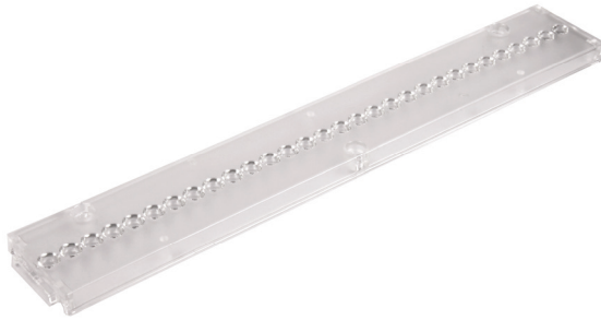
(Weight/Peso 1,76 oz. / gr. 50)