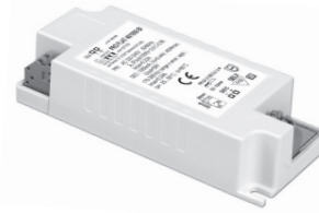
PRO FLAT BI