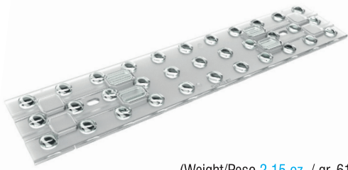
(Weight/Peso 2,15 oz. / gr. 61)