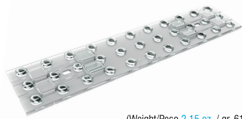
(Weight/Peso 2,15 oz. / gr. 61)