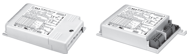
DC MAXI JOLLY US