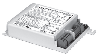
DC MAXI JOLLY US BI