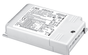
DC MAXI JOLLY HV