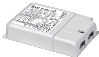
DC JOLLY HC MV