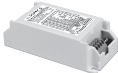
PROFESSIONALE 1-10V BI