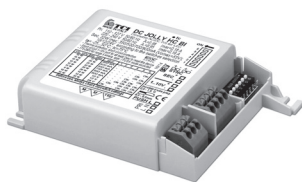
DC JOLLY HC BI