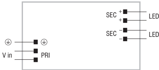
DC 150W 24V SLIM