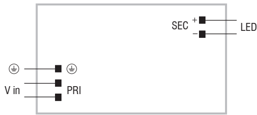
DC 100W 24V SLIM