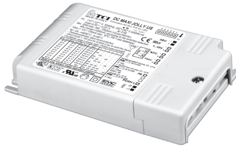
DC MAXI JOLLY US