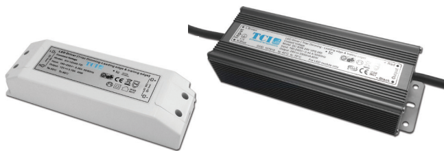
DC 45W VPS MD