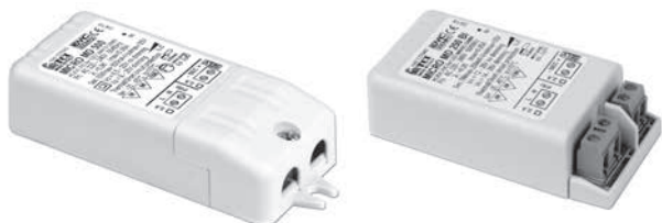
MICRO MD 250