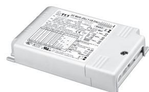
DC MAXI JOLLY US DALI