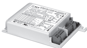
DC MAXI JOLLY US DALI BI