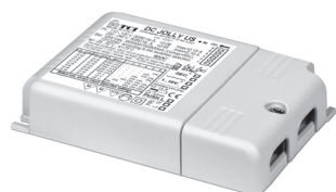
DC JOLLY US