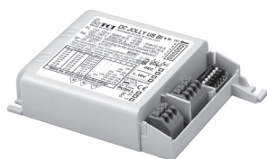
DC JOLLY US BI