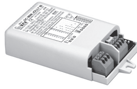
DC MINIJOJLY BI