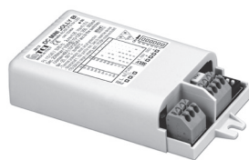
DC MINIJOJLY BI