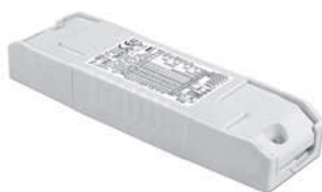
PRO FLAT 40