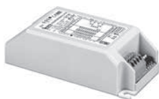
PROFESSIONALE 34 BI