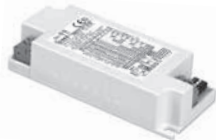
PRO FLAT 40 BI