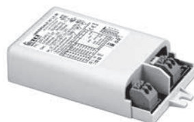
UNIVERSALE 20 LC BI