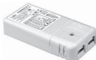
UNIVERSALE 20 LC