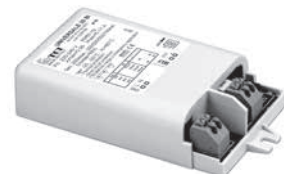
UNIVERSALE 20 BI