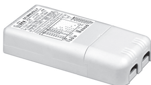
DC MINI JOLLY