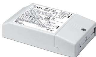
MP 65 H/2