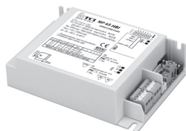
MP 65 HBI