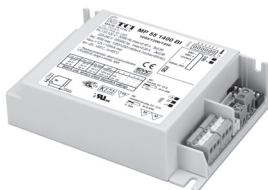
MP 55 HC BI - MP 55 1400 BI