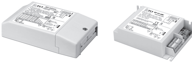
MP 65 H/2