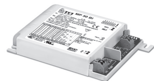
MP 50 BI