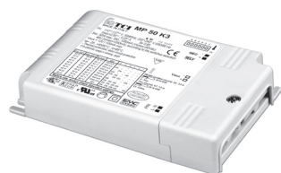
MP 50 K3