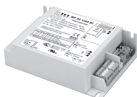
MP 55 HC BI - MP 55 1400 BI