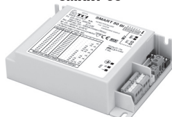
SMART 50 BI