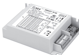
SMART 70 BI