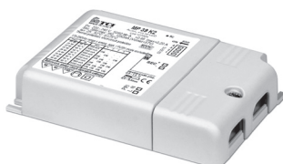
MP 39 K2