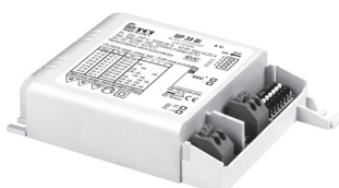
MP 39 BI