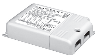
MP 32 HV K2