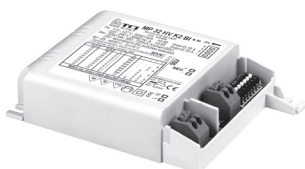
MP 32 HV BI