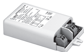
UNIVERSALE 20 BI