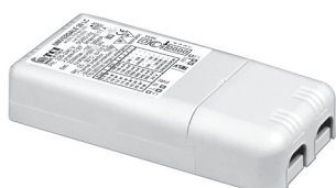
UNIVERSALE 20 LC