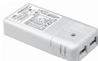
UNIVERSALE 20 LC