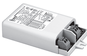
UNIVERSALE 20 LC BI