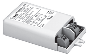
UNIVERSALE 20 BI