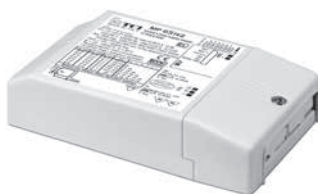
MP 65 H/2