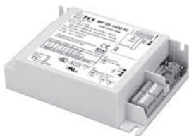
MP 55 HC BI - MP 55 1400 BI