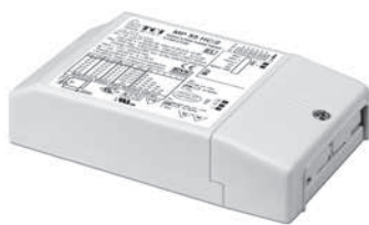
MP 55 HC/2 - MP 55 1400/2