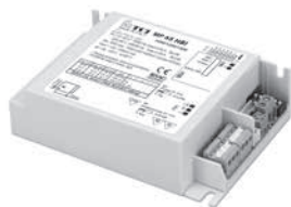
MP 65 HBI