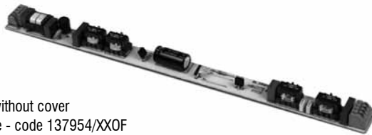
BTS without cover codice - code 137954/XXOF

Schema di collegamento a pagina 57 n° 18 - Wiring diagram page 57 n° 18