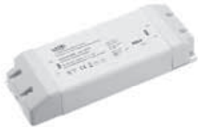
CVD FLAT 200W