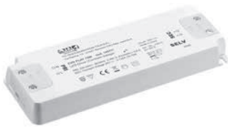
CVD FLAT 30/75/150W