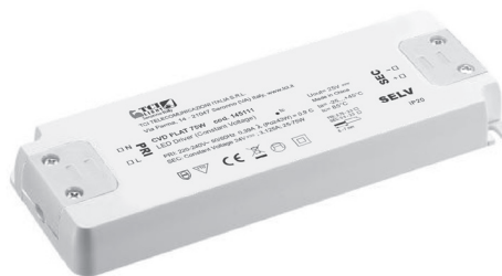
CVD FLAT 30/75/150W