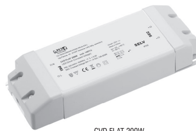
CVD FLAT 200W