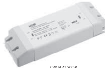
CVD FLAT 200W