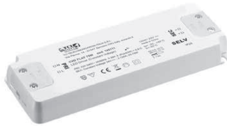
CVD FLAT 30/75/150W