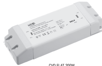
CVD FLAT 200W