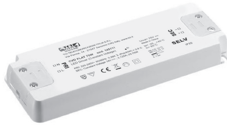
CVD FLAT 30/75/150W