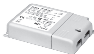
DC 35W K2