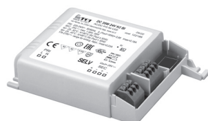
DC 35W K2 BI