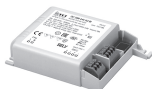
DC 35W K2 BI