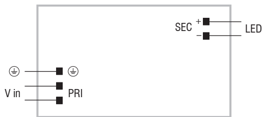
DC 100W 24V SLIM