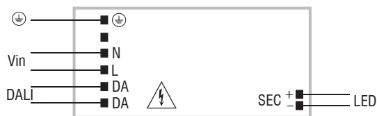
DALI diagram Collegamento DALI