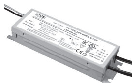
DC 60W 24V VPSD 0-10 V