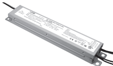
DC 100W 24V VPSD 0-10 V