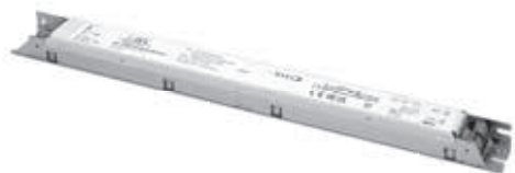
DC 120W 24V SLIM RM DALI