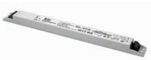
DC 70W 24V SLIM R DALI