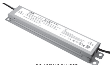
DC 100W 24V VPSD