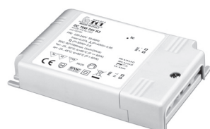
DC 70W K3