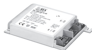
DC 70W K3 BI