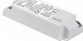
PRO FLAT LC DALI BI