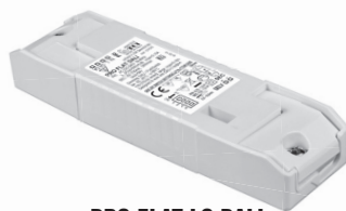
PRO FLAT LC DALI