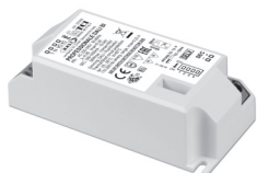
PROFESSIONALE DALI BI