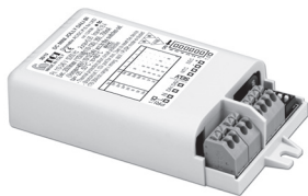
DC MINI JOLLY DALI BI