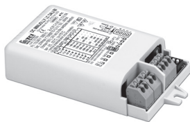
DC MINI JOLLY DALI BI