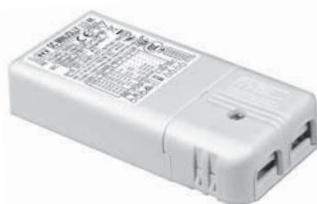
DC MINI JOLLY