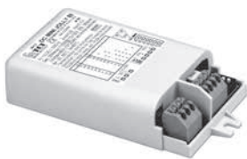
DC MINI JOLLY BI