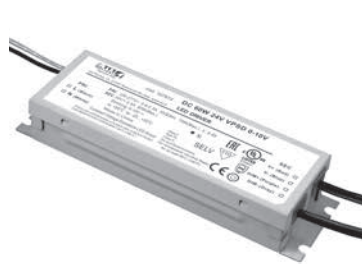
DC 60W 24V VPSD 0-10 V