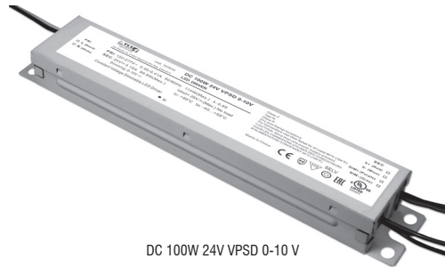
DC 100W 24V VPSD 0-10 V