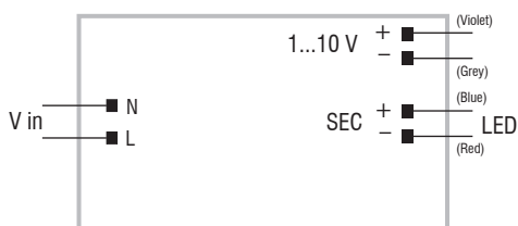
1...10 V diagram - Collegamento 1...10 V

Wiring diagrams - Schemi di collegamento (Max. LED distance at page info8 - Massima distanza LED a pagina info8)