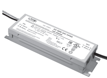
DC 60W 24V VPSD