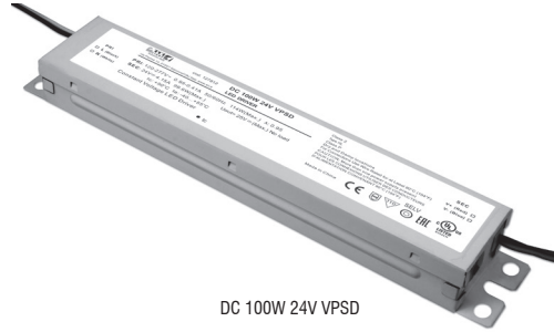
DC 100W 24V VPSD