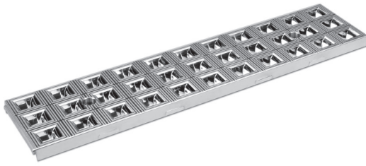
(Weight/Peso 3,6 oz. / gr. 102)